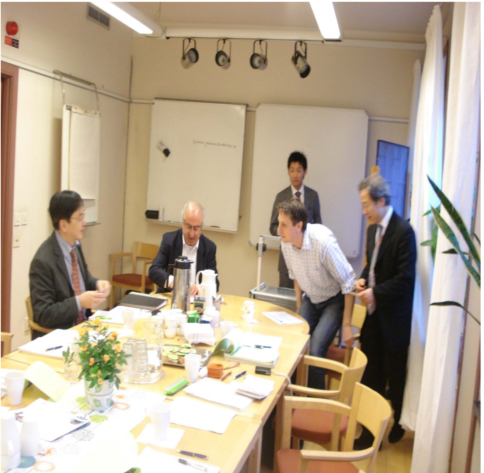
東京財団地方議会の改革