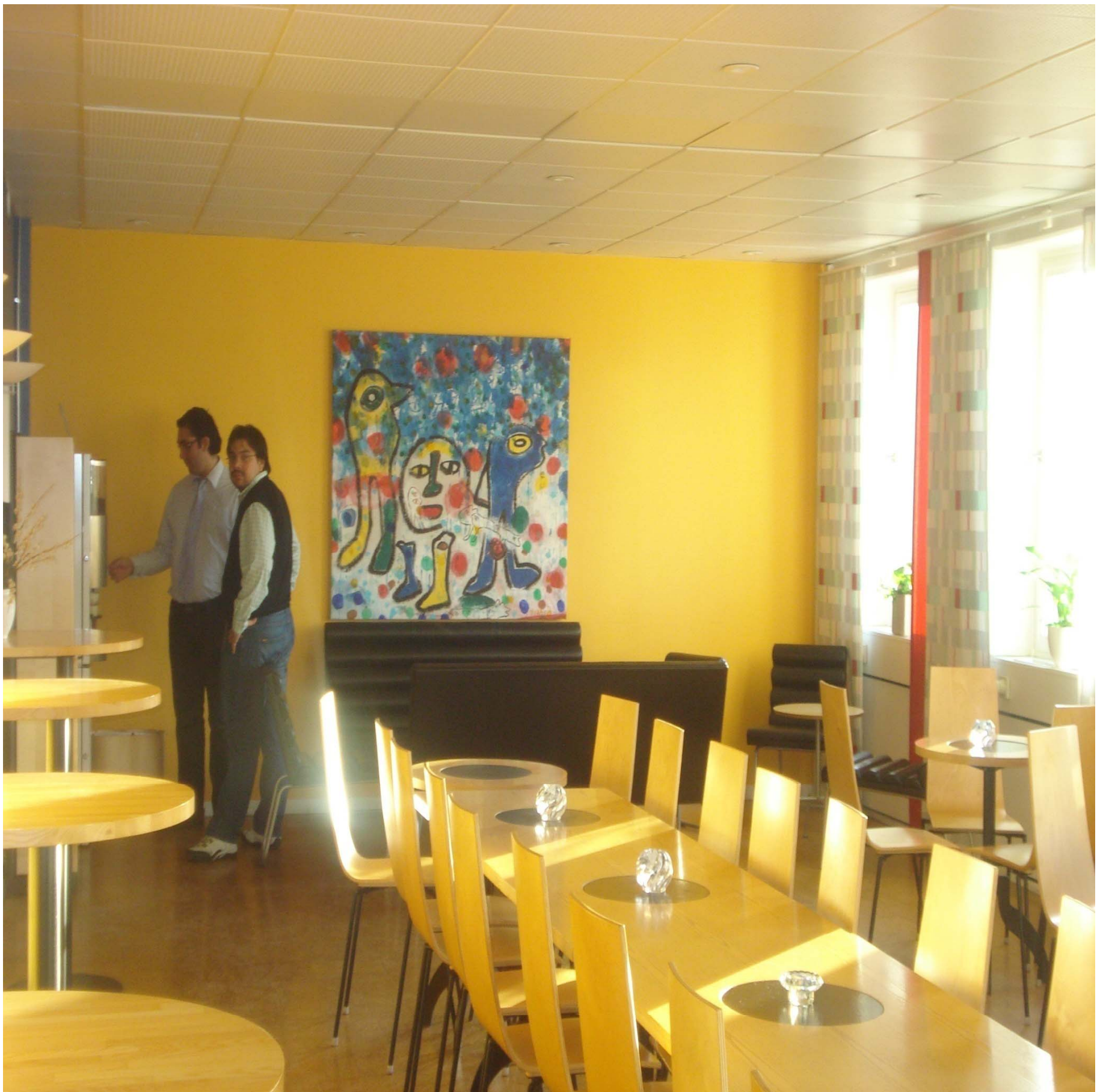
東京財団地方議会の改革