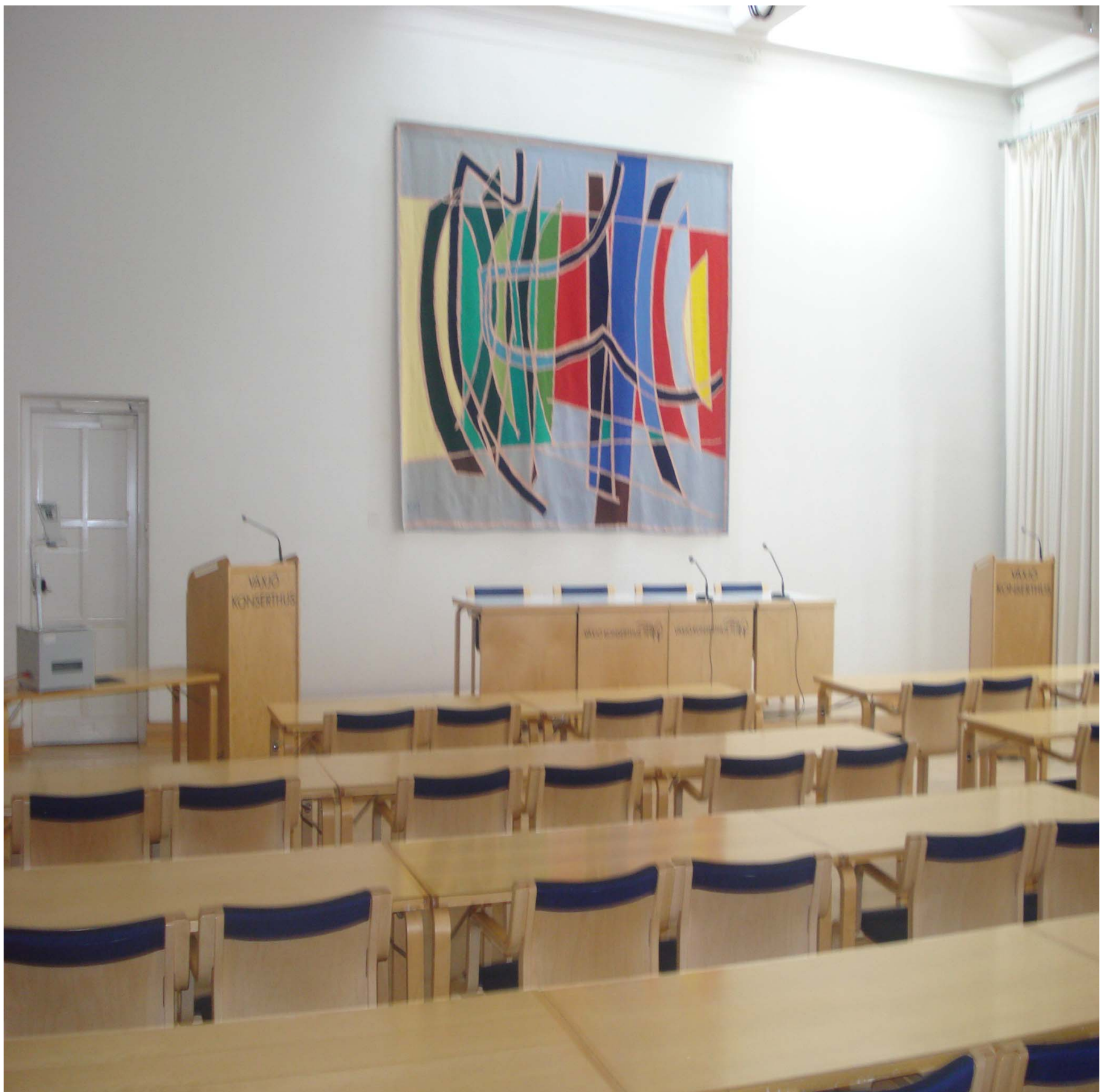
東京財団地方議会の改革