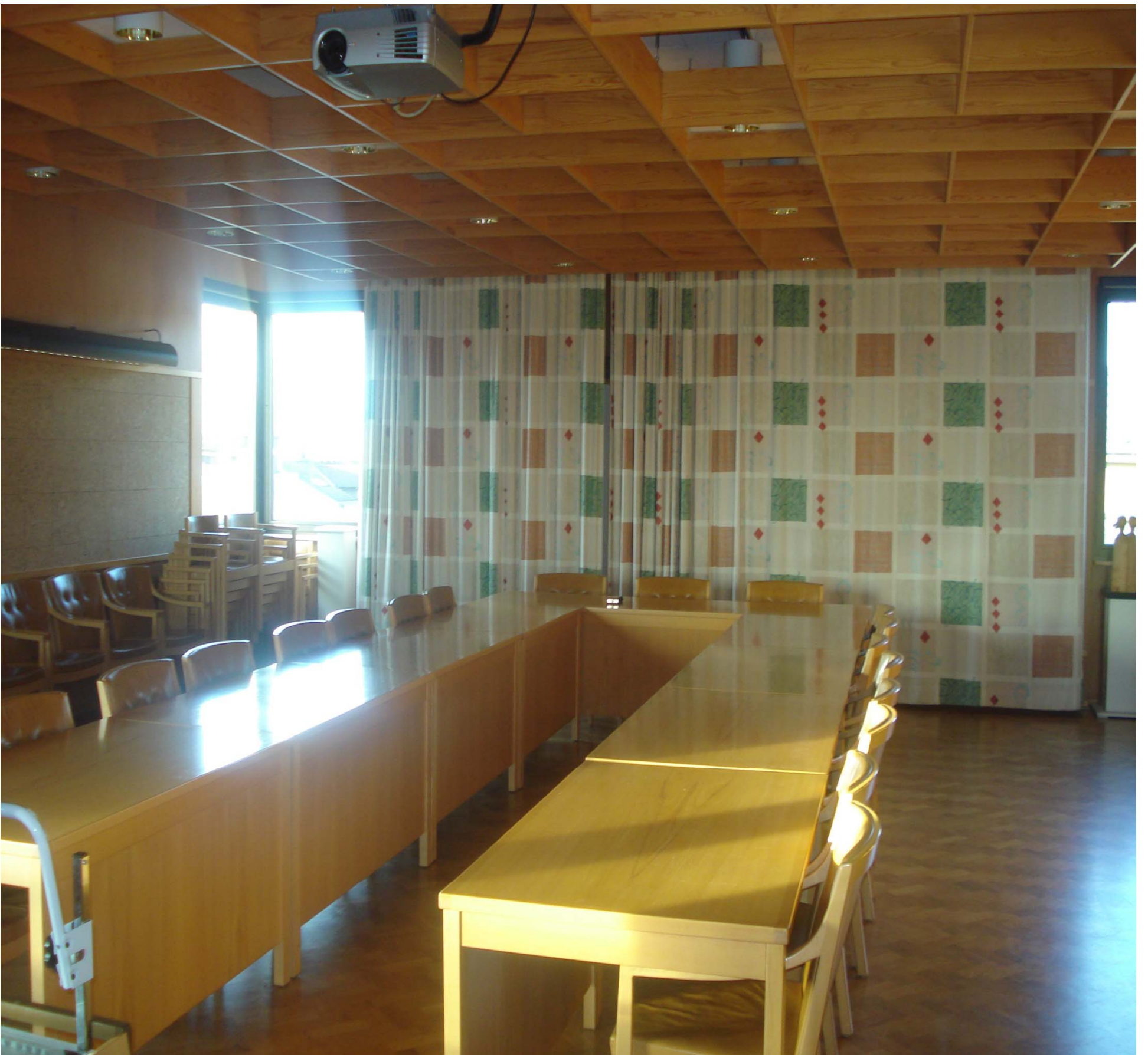
東京財団地方議会の改革